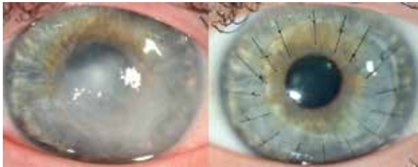
Beispiel einer Hornhauttransplantation bei starken Hornhauttrübungen durch ein Hornhautulkus. Links: vorher – rechts: 8 Wochen nach erfolgreicher Transplantation.

Seit über 100 Jahren können schwere Augenhornhauterkrankungen erfolgreich mittels Hornhauttransplantation behandelt werden. Voraussetzung hierzu ist das Vorhandensein von postmortalen Hornhautgewebespenden . Ca. 5.000 Hornhauttransplantationen werden jährlich allein in Deutschland durchgeführt, der Bedarf